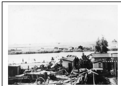
Heutiger Biergarten 1936